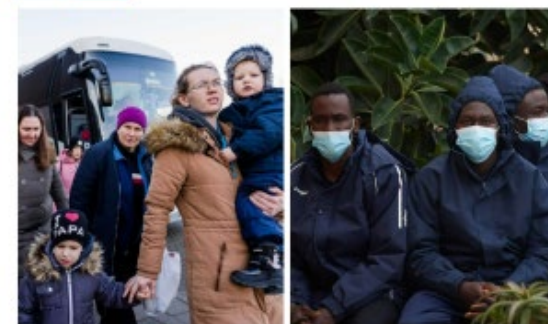
1000 begunci in ilegalni migranti