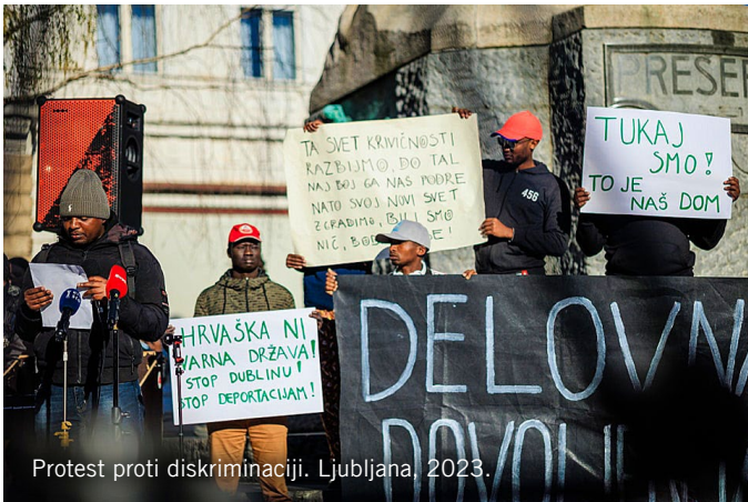
Protest proti diskriminaciji. Ljubljana, 2023.

Vsak človek ima več kot eno identiteto. Begunec_ka, migrant_ka in prosilec_ka za azil so lečasni izrazi in ne odražajo celotne identitete žensk, otrok in moških, ki so zapustili svoje domove, da bi začeli novo življenje v drugi državi. Ko uporabljamo te oznake, se moramo spomniti, da se od številnih načinov, na katere se ljudje opisujejo, ti izrazi nanašajo izključno na eno osebnostno okolje: izkušnjo, da so zapustili svojo državo. Identiteto osebe pa sestavlja veliko več stvari. Zato pravni status osebe ne more izražati celotne identitete in osebnosti begunca_ke, prosilca_ke za azil ali migranta_ke. Nihče ne more biti le to, kar je njegov pravni status.