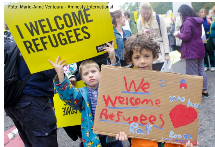
Shod za podporo beguncev_k v Londonu.