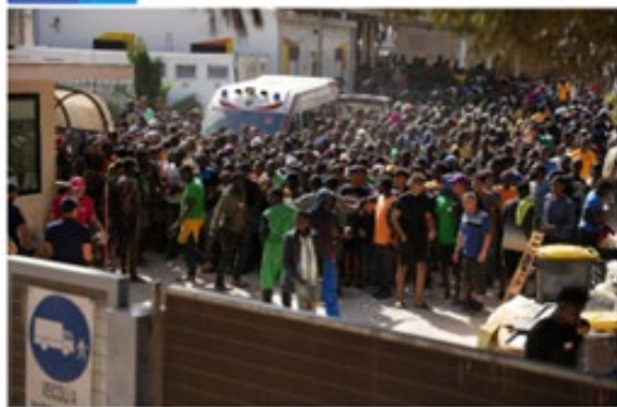
Regijski migranti na Lampedusi

Množični prihodi migrantov je na italijanskem otoku Lampedusa povzročil kaotične razmere. Kot kaže pa niso nezadovoljni samo tanzanijski prebivalci, ampak tudi migranti. Slednji so se namreč odločili, da zaradi nezadovoljstva s postopanjem italijanskih oblasti, kar protestirajo proti njim, saj jih prepočasno prevažajo v celinski del našega kontinenta. Tudi predsednica Evropske komisije Ursula von der Leyen napoveduje, da bodo pomorske blokade in ustavitve porazdeljevanja ilegalcev po državah EU.