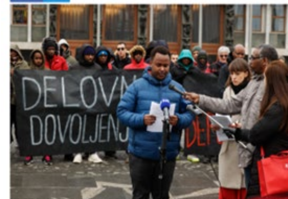
Migrantska konferenca izvedla protest za delo v Nemčiji (Ljudski naletni in sponadniki v sponadu potekajo na letni sponadu potekajo za delo v Sloveniji)