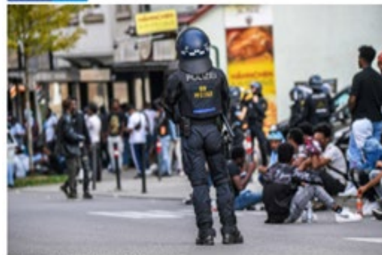
V EU je potekala silovita napad protest evropske države.

Na spiet je pronicel posevek naših izgedov v Stuttgartu. Nemčija je z sprejemom Eritrejskih migrantov sprejela tudi njihove notranje etnične konflikte. V sponadu je bilo poškodovanih 26 policistov, ki so skušali ustaviti nasilje in 6 Eritrejcev (štirje uveličani dojočka in dva protestniki).