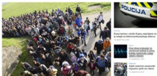
Velika Kladuša, 15. avgust 2022.