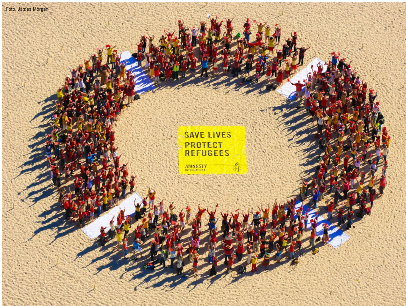
Akcija Amnesty International Avstralije, v kateri so pokazali solidarnost z begunci_kami.