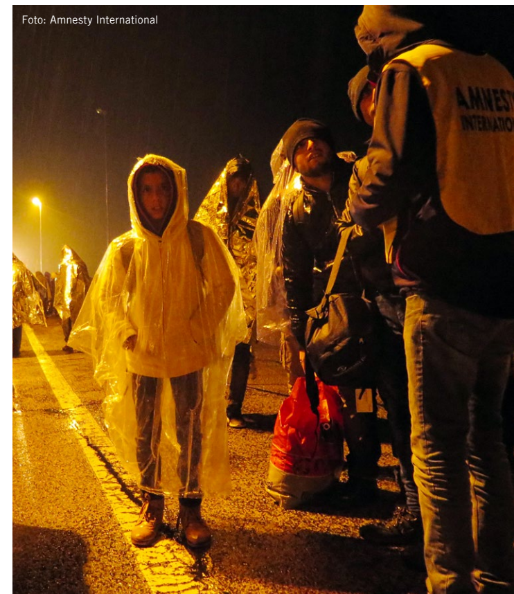
Begunci na slovensko-hrvaški meji 2015.